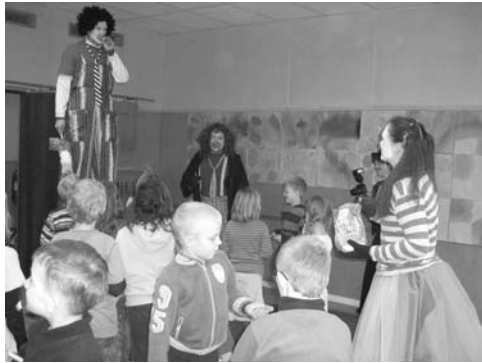
Barnen hämtas på skolan maskeradagen.

Björken, det är fritids. Här varierar personalen lite mer år från år, men verksamheten består. Hit går skolans Lyktvandring vid S:t Martin. Bland de populäraste aktiviteterna tillhör den årliga Maskeradagen, då både personalen och fritidsbarnen klär ut sig, leker och fikar.