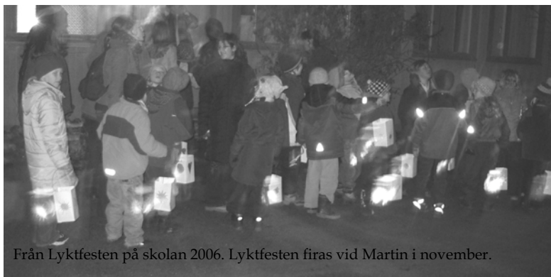
Från Lyktfesten på skolan 2006. Lyktfesten firas vid Martin i november.

Det aktiva föräldraskapet i skolan ger trygghet och insyn och ett gott samarbete mellan elever, lärare och föräldrar. Vi befinner oss på så sätt i ett gemensamt sammanhang. Detta sammanhang är en förutsättning för Waldorfpedagogiken.