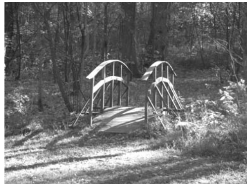
Vägen till Björken går genom skogen och strax innan du är framme går du över denna bro.