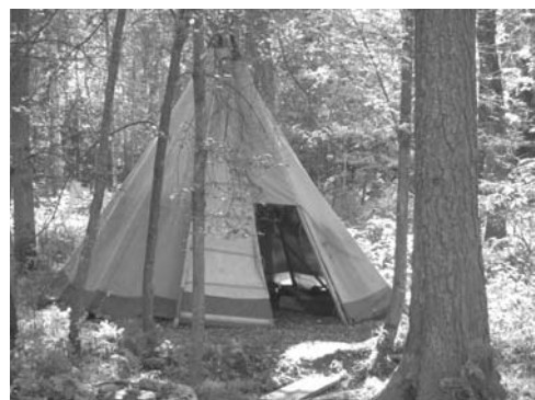
Här tältet där många pinnbröd grillats.